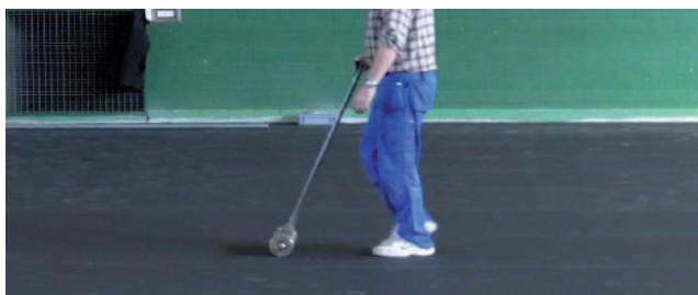
Figur 3: Pressa ner det installerade Uni Color-golvet