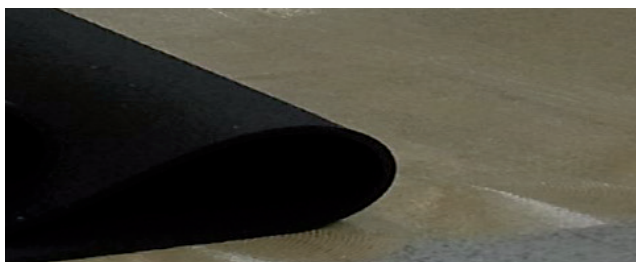
Figur 2: Installation och inriktning av Uni Color-produkt