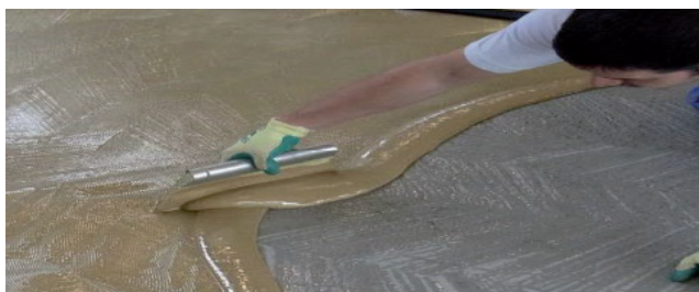
Figur 1: Limapplicering på det rena och avjämnade underlaget

För de flesta tillämpningar rekommenderas det att applicera ett beläggingsmaterial på Uni Color-golvets yta. Applicera beläggingsmaterial som är lämpligt för denna typ av gummigolv med en målarroller. Fördela materialet jämnt över den torr och rena ytan enligt tillverkarens bruksanvisning. En lämplig beläggning appliceras generellt om materialet ska användas som golv för inomhusbruk. Några av fördelarna med att använda tätning är enklare rengöring och att färgerna håller längre. Efter att beläggning har applicerats på golvet får ytan inte vidröras förrän den har härdat fullständigt.