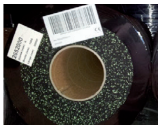
Figur 4: Beakta information om produktionspartiet på etiketterna på rullarna

Beakta och följ tillverkarens anvisningar vid användning av speciallim, 2-komponents polyuretanlim eller fyllnadsmaterial. Limning av Uni Color-golv får endast ske på ett torrt och rent underlag. Vidrör inte ytan efter installation förrän limmet har härdat fullständigt. Detsamma gäller vid användning av ett tätningsmaterial för ytan på det installerade golvet. Se till att golvet som ska tätas är rent och fritt från alla slags föroreningar innan ett tätningsmaterial appliceras. Rengör vid behov ytan innan den tätas. Beträd inte det tätade golvet förrän tätningsmaterialet är fullständigt härdat. Om reklamation skulle vara aktuellt på grund av skador orsakade av felaktigt levererade varor, defekta varor, otillräckliga mått eller andra eventuella fel ska en reklamation göras omedelbart och installationen avbrytas direkt. En reklamation gällande levererat material är endast möjlig vid obehandlat material och med angivelse av produktionspartiets referensnummer (fig. 5).